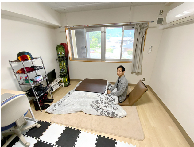
広い窓からの眺めは最高！