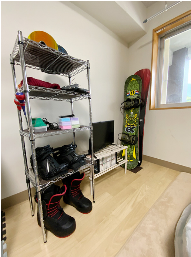
趣味のスノーボードのグッズコーナー