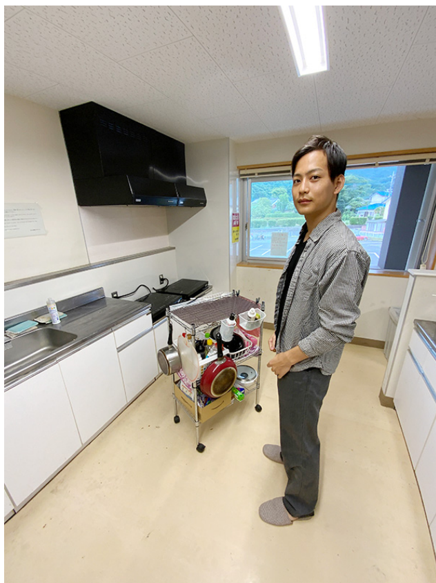
共用キッチンへは料理道具一式をワゴンで持参！